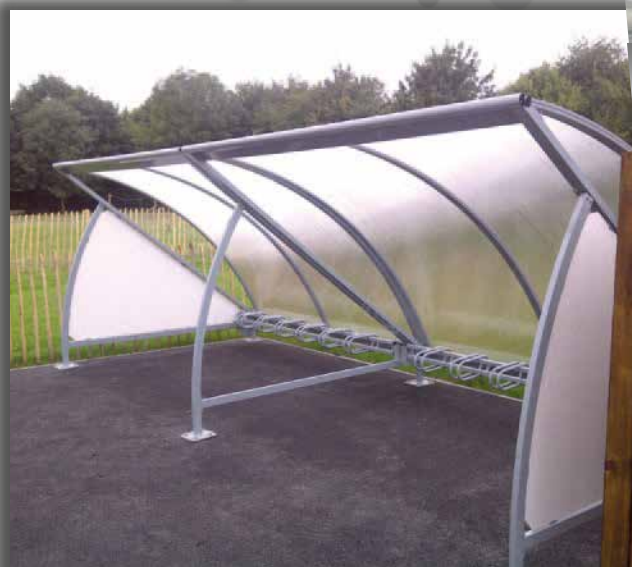
Modèle présenté : abri demi-lune initial + complémentaire