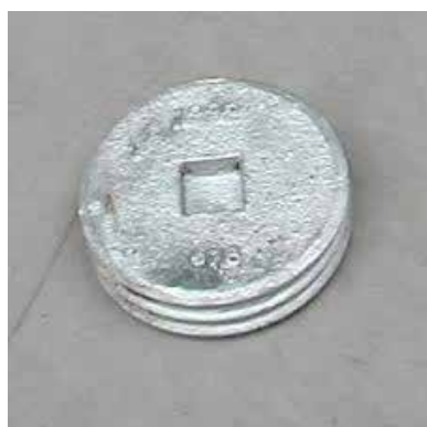
bouchon pour douille