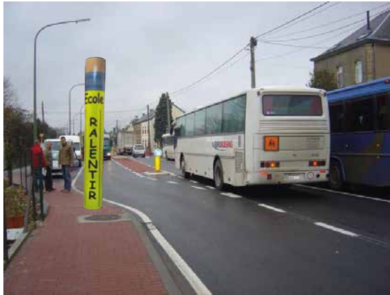
Crayon 3D - Ref : 13001002

Notre crayon 3D fluo est conçu pour une visibilité à 360° et une efficacité accrue.